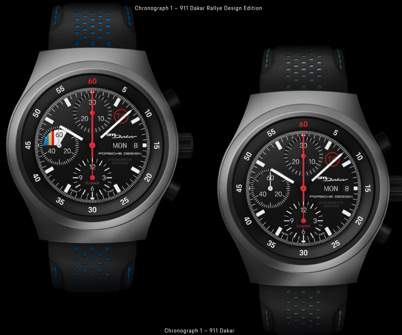
Chronograph 1 – 911 Dakar Rallye Design Edition